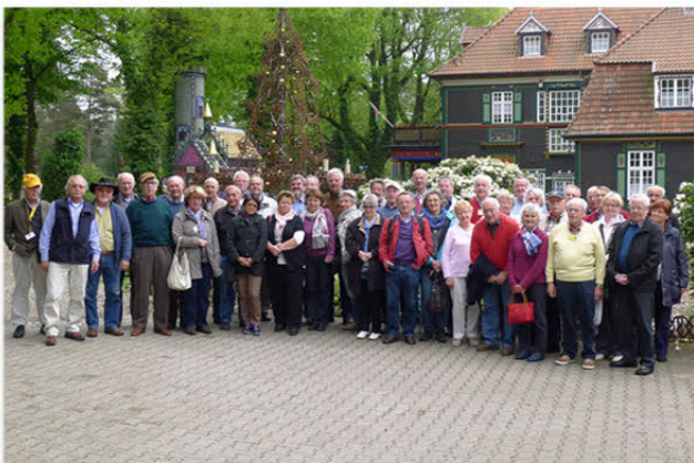
Besuch in Iserhatsche