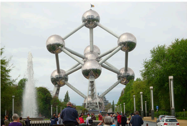
Am Atomium in Brüssel