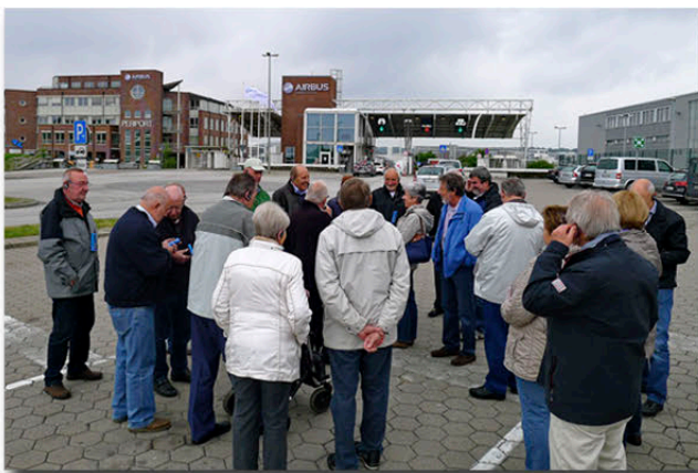
Besuch bei Airbus

45 Mitglieder machen im Mai eine Reise nach Hamburg zu Airbus mit anschließendem Rahmenprogramm.