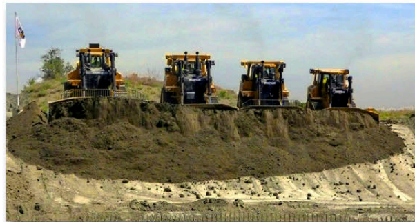
„Big Push“- das Finale