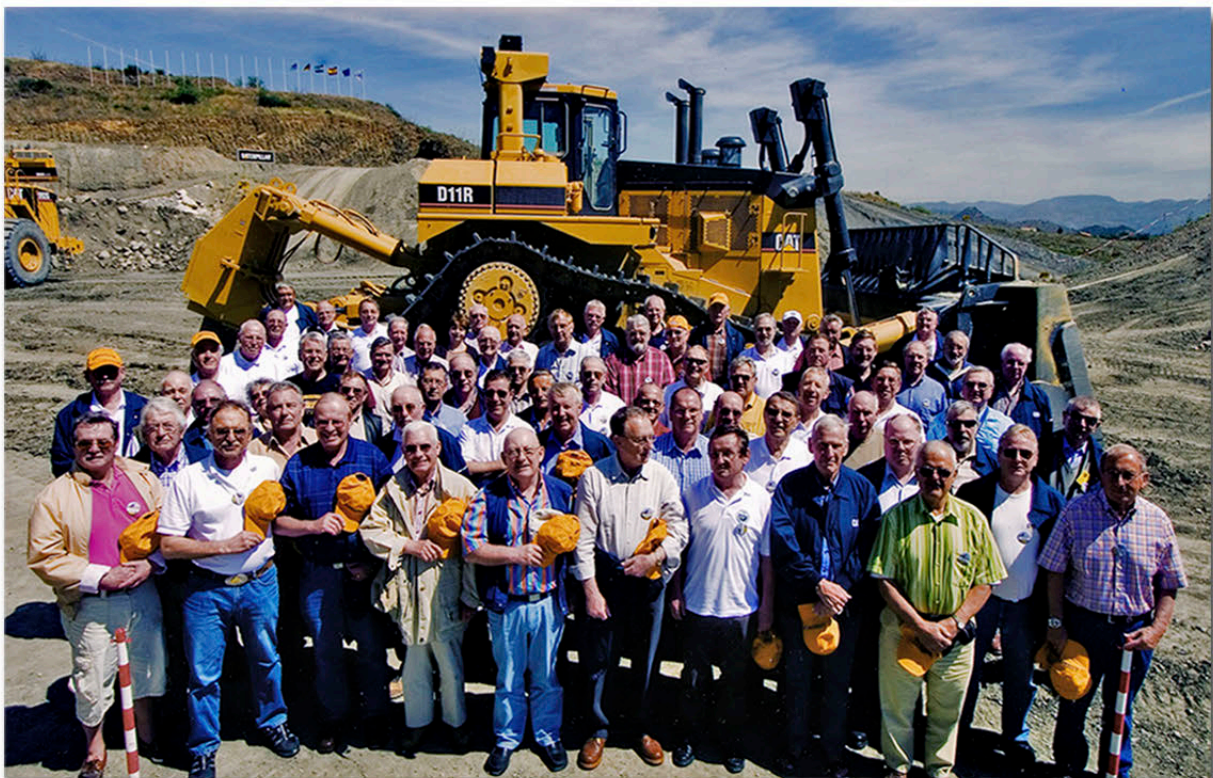
Die Mitglieder des ZVC vor der CAT D11R