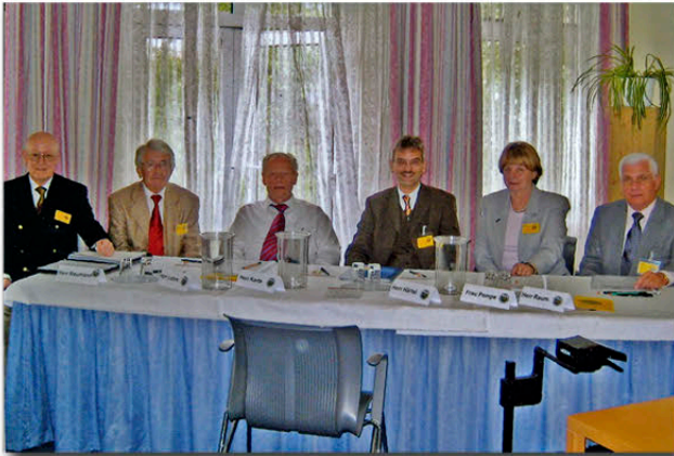
Der Vorstand 2005

Am 13. Mai findet die erste Mitgliederversammlung in Erfurt statt.