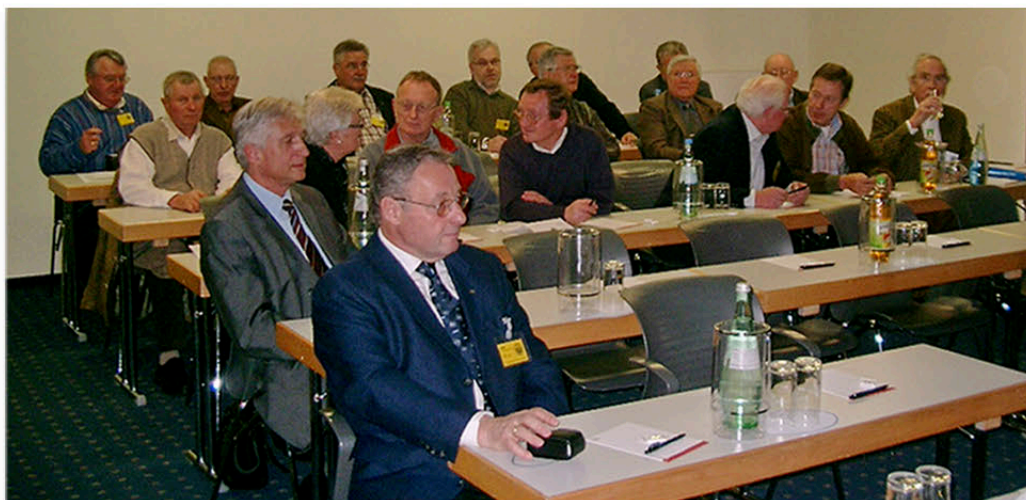
Die Mitglieder hören den Ausführungen interessiert zu