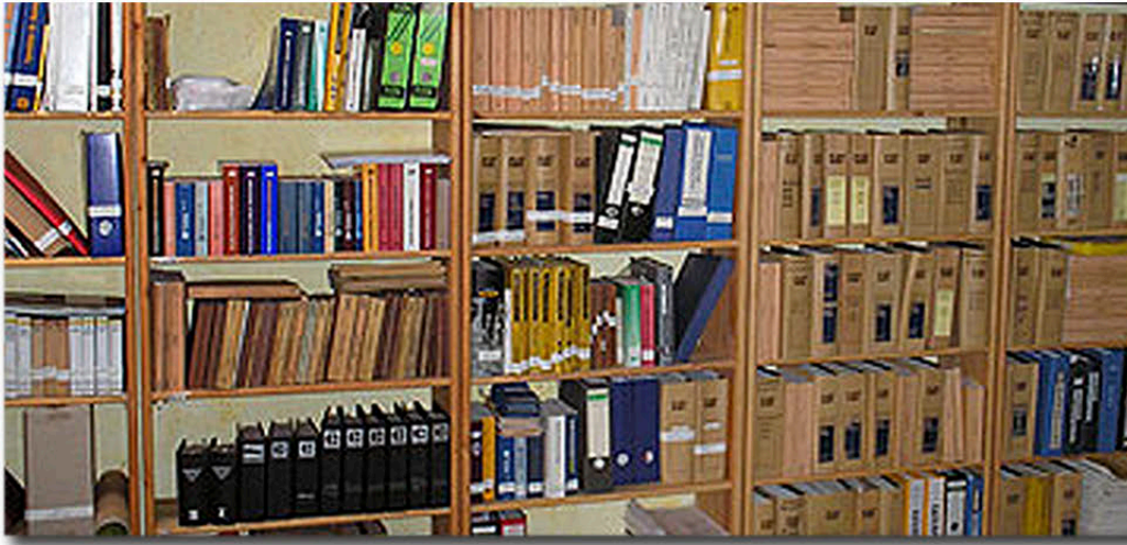
Blick in die alte Bibliothek

Im März umfasst die Baumaschinen-Bibliothek bereits mehr als 500 Exponate.