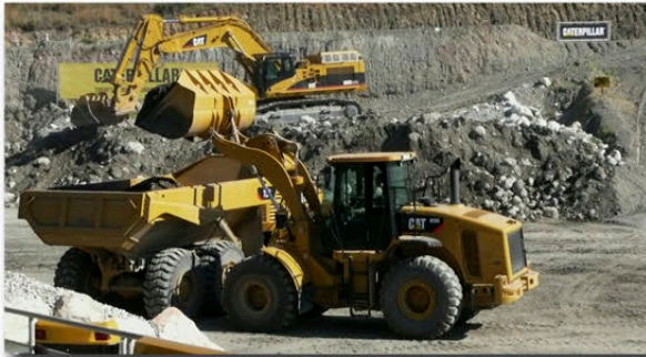
Praktischer Einsatz im Gelände