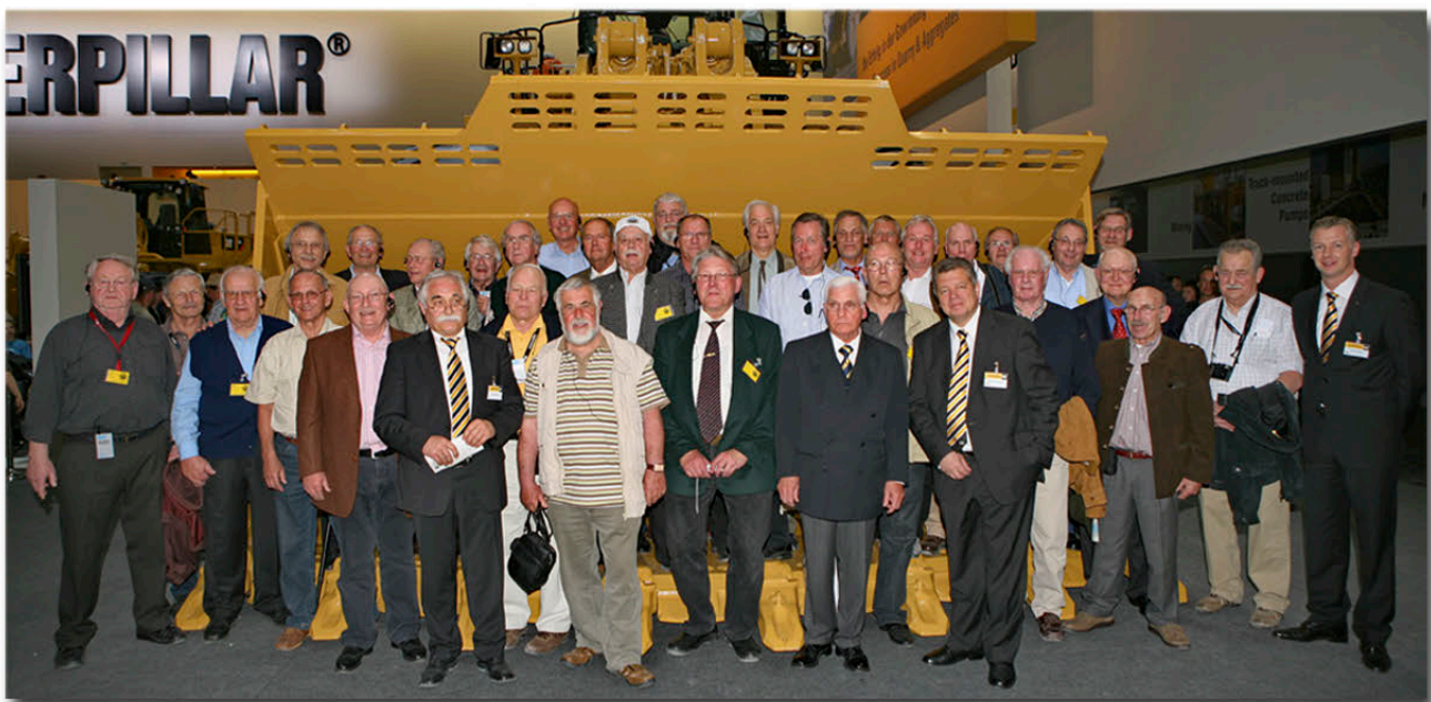
Nach der Führung noch einmal gemeinsam vor der Kamera