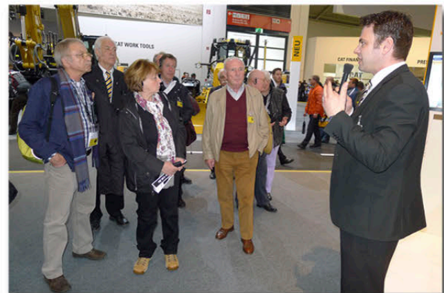
Die Mitglieder erfahren viel über den technischen Fortschritt bei den CAT Produkten