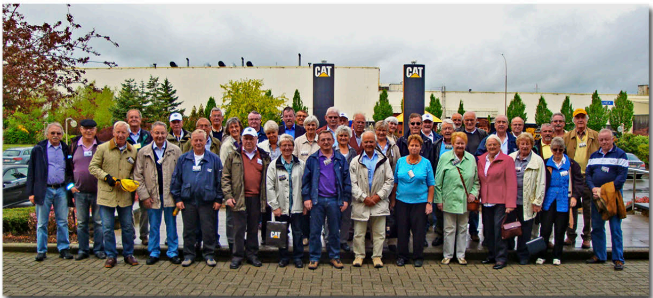
Gruppenfoto nach der Werksführung bei CAT Gosselies

53 Mitglieder nehmen an der Reise nach Belgien zu CAT Gosselies, CAT Grimbergen und anschließendem Besuch in Brüssel teil.