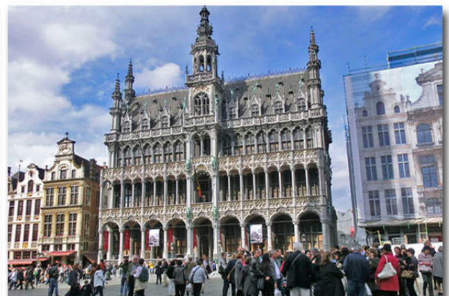
Vor dem Brüsseler Rathaus