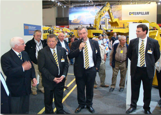
Die Geschäftsleitung begrüßt die Mitglieder

50 Mitglieder besuchen im April die BAUMA in München.