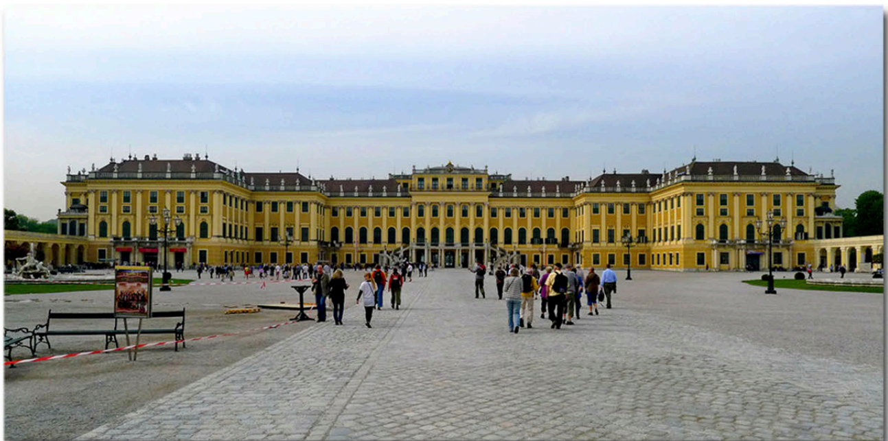
Besuch im Schloss Schönbrunn