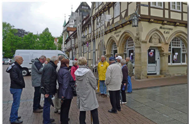
Stadtführung durch Celle