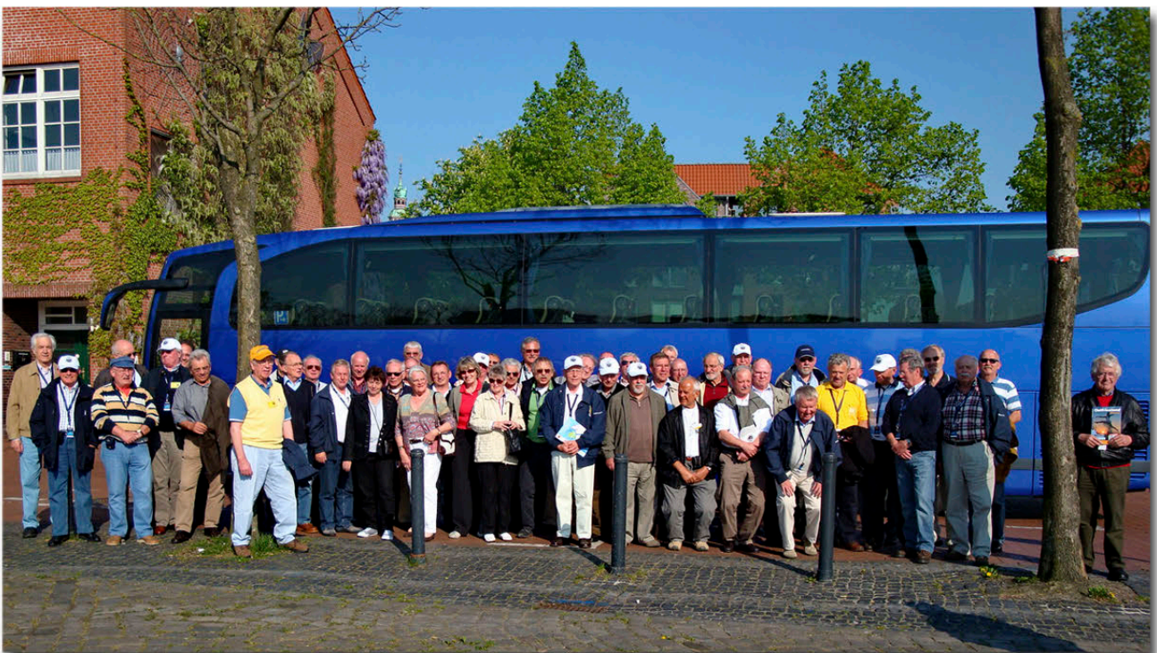
Die Reisegruppe vor dem Bus beim Besuch in Leer