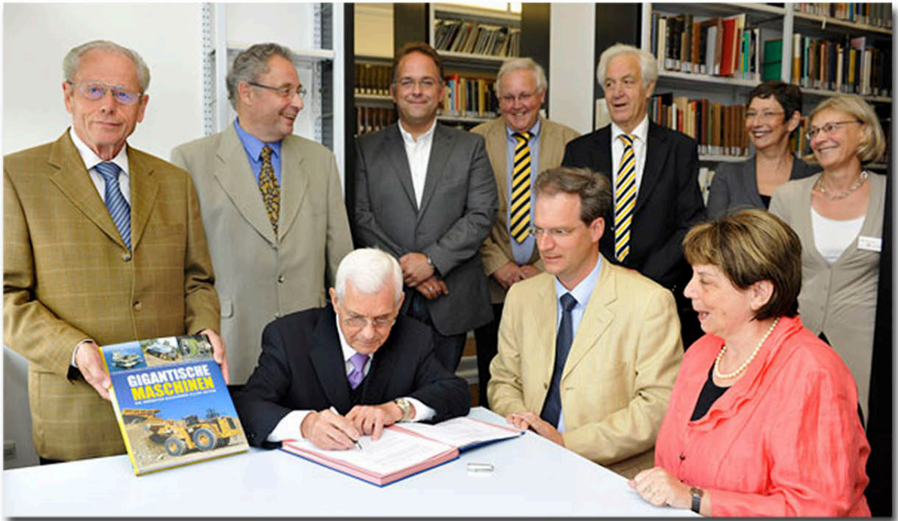
Der ZVC übergibt seine Bibliothek an das Technoseum in Mannheim

Im Juni werden zahlreiche Exponate an das Technoseum, dem Landesmuseum für Technik und Arbeit, in Mannheim übergeben. Insgesamt werden 2203 Datensätze in die Bibliothek übernommen und 209 Datensätze im Archiv erfasst.