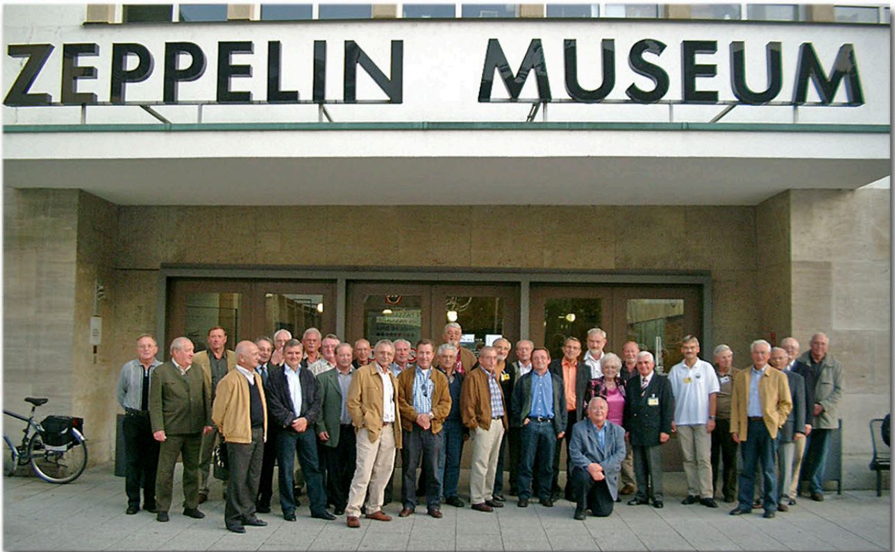
Die Mitglieder vor dem Zeppelin Museum in Friedrichshafen

Eine Seminarreise folgt am 13. Oktober nach Friedrichshafen.