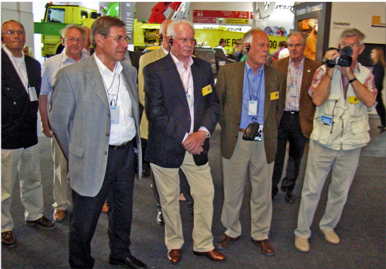
Interessierte Mitglieder bei der Führung durch die Ausstellungshalle