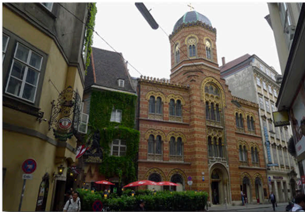
Griechenkirche am Fleischmarkt