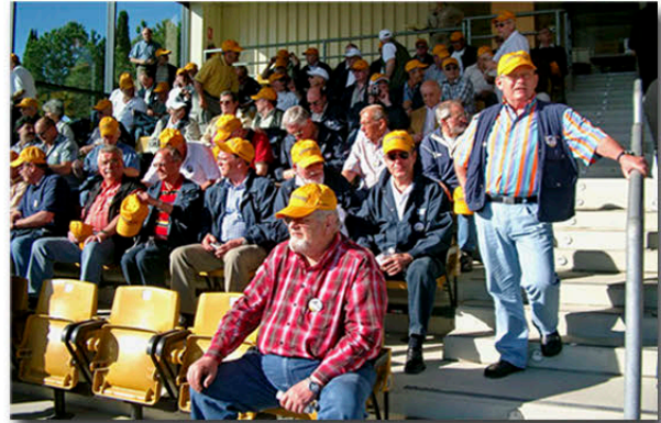
Gespannt verfolgen die Mitglieder die Vorführungen