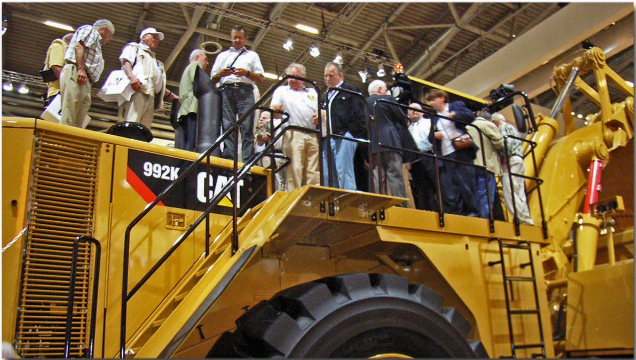
Der ZVC erobert den Radlader 992K auf dem Caterpillar-Zeppelin Stand

Am 29. April besucht der ZVC die BAUMA in München.