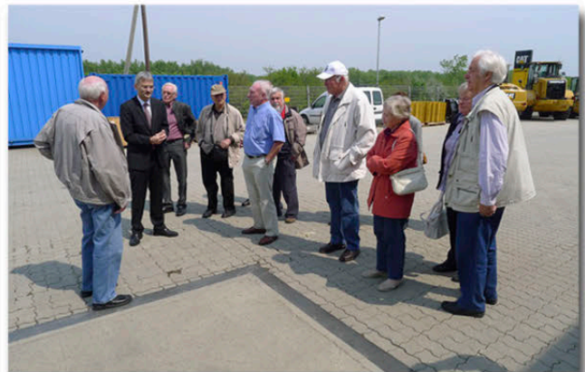
Begrüßung und Führung in der Niederlassung Fischamend in Österreich.