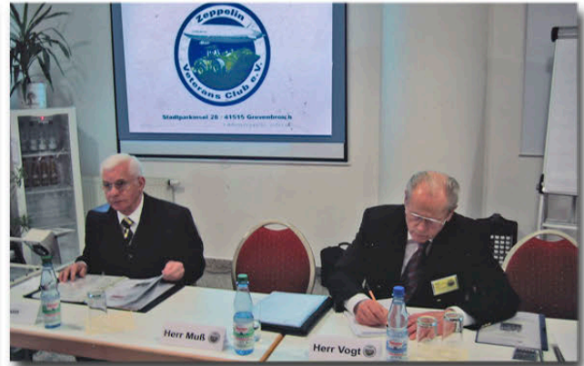
Mitglieder und Vorstand sprechen gemeinsam die Tagesordnungspunkte durch

50 Mitglieder besuchen im April die BAUMA in München.