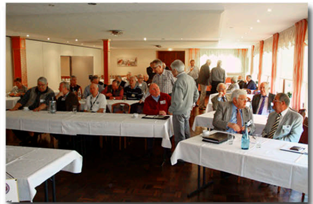
Vorstand und Mitglieder in Hellwege

53 Mitglieder nehmen an der Reise nach Belgien zu CAT Gosselies, CAT Grimbergen und anschließendem Besuch in Brüssel teil.