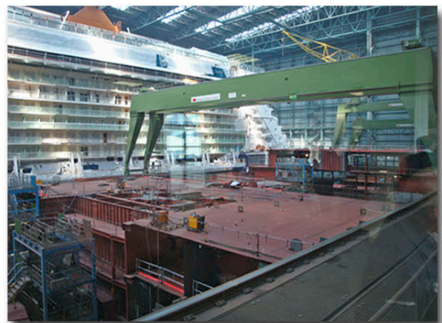
Ein Besuch mit interessanten Eindrücken