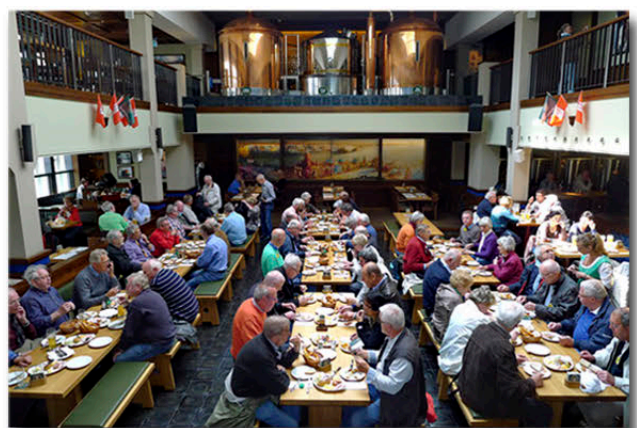
Brotzeit im Hamburger Brauhaus