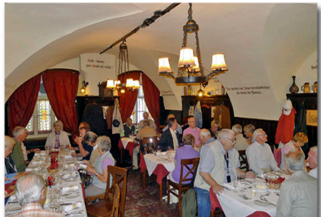
Speisen im Griechenbeisl