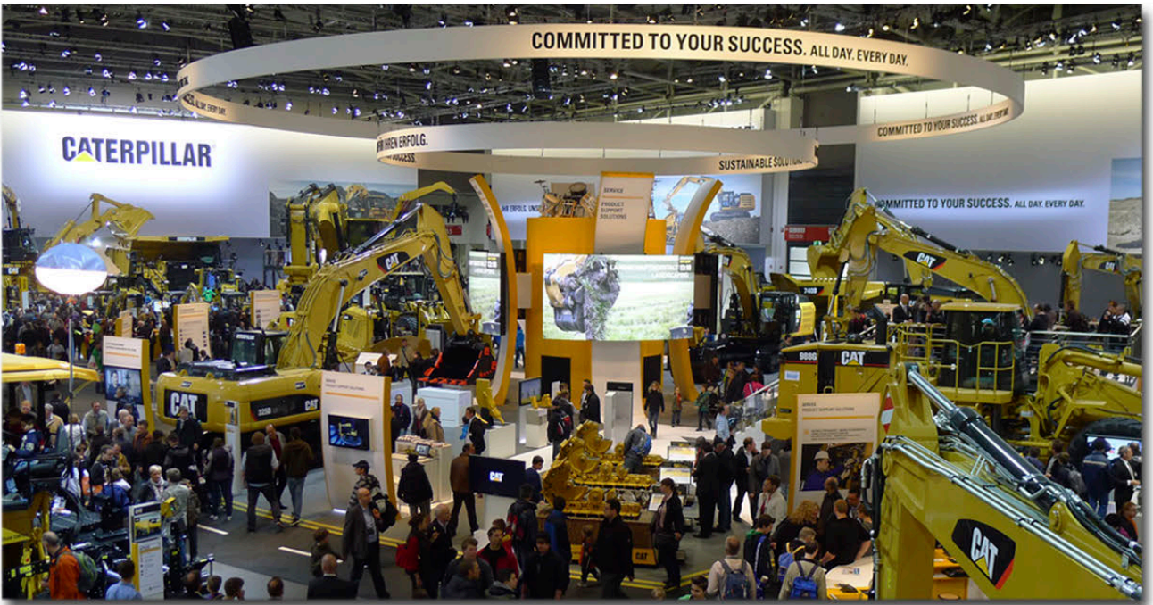
Viele interessierte Besucher am CAT- Zeppelin Stand

46 Mitglieder besuchen im April die BAUMA in München.